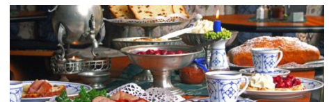
Bergische Kaffeetafel mit allem dröm un dran

Sonntag, 27.10.2019, 13:30 – 17:00 Uhr Niederbergisches Museum Wüfrath Kosten pro Person 18,- EUR