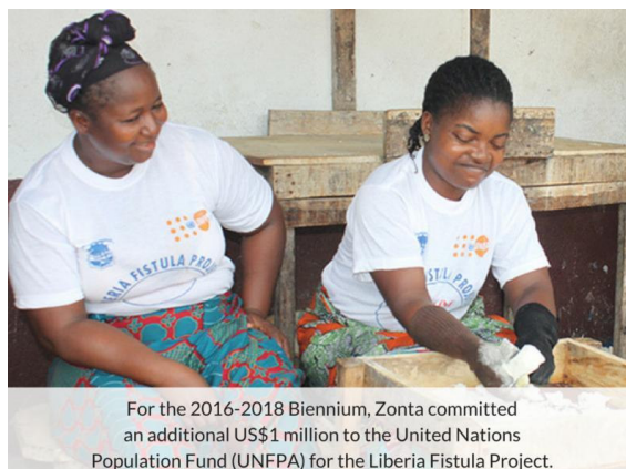
For the 2016-2018 Biennium, Zonta committed an additional US$1 million to the United Nations Population Fund (UNFPA) for the Liberia Fistula Project.

Ca. 1,530 Frauen wurden operiert und 384 rehabilitiert und wieder in ihre Gemeinden integriert.